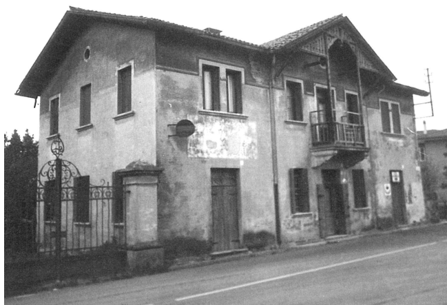
La sede nel 1981 e, a destra, oggi